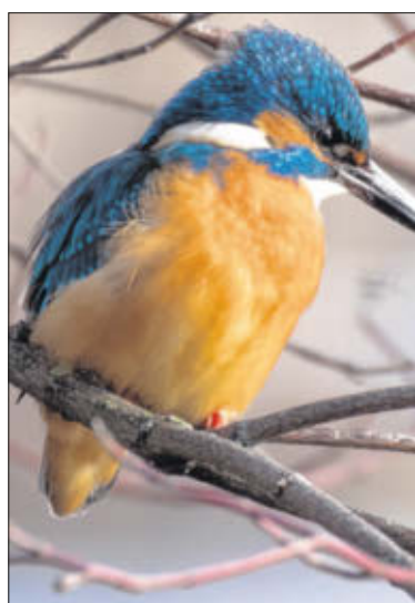
Der Eisvogel fällt durch sein blau-gelbes Gefieder auf.

Das Recknitztal hat eine Größe von 1450 Hektar und damit fast so groß wie die Insel Hiddensee. Es ist eines der wenigen erhaltenen Niedermoore Mecklenburg-Vorpommerns mit offenen Torfstichen und zahlreichen Altarmen. Rund 100 Brutvogelarten leben hier. Feuchtwiesen, Erlenbruch und Auenwälder sowie Röhricht bieten ihnen einen abwechslungsreichen Lebensraum.