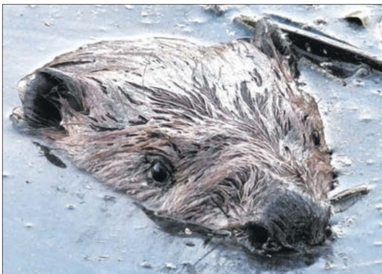
Biber fühlen sich an der Recknitz wohl. Entlang der Strecke sind zahlreiche Biberburgen zu sehen.